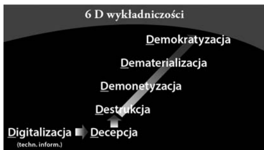
Rysunek 1.2. Sześć D wykładniczości: digitalizacja, decepcja, destrukcja, demonetyzacja, dematerializacja, demokratyzacja

— na bazie mojego. Tego rodzaju wymiana zachodziła bardzo powoli w początkowym okresie rozwoju naszego gatunku (kiedy jedynym sposobem przekazywania informacji było snucie opowieści przy ognisku), przyspieszyła po wynalezieniu prasy drukarskiej i nabrała imponującego tempa, kiedy technologie komputerowe umożliwiły cyfrowe przedstawianie, gromadzenie i wymianę pomysłów. Wszystko, co można scyfrzować — czyli przedstawić za pomocą zer i jedynek — może się rozprzestrzeniać z prędkością światła (albo przynajmniej z prędkością internetu) i być przedmiotem swobodnej, darmowej reprodukcji i wymiany. Co więcej, rozprzestrzenianie się cyfrowych treści odpowiada spójnemu wzorcowi, którym jest krzywa wzrostu wykładniczego. W przypadku Kodaka, kiedy branża wspomnień przestawiła się z procesu fizycznego (fotografowanie na filmie i przechowywanie obrazów na papierze) na cyfrowy (fotografowanie i przechowywanie w postaci zer i jedynek), tempo jej rozwoju stało się całkowicie przewidywalne. Można je było przedstawić za pomocą krzywej wykładniczej.