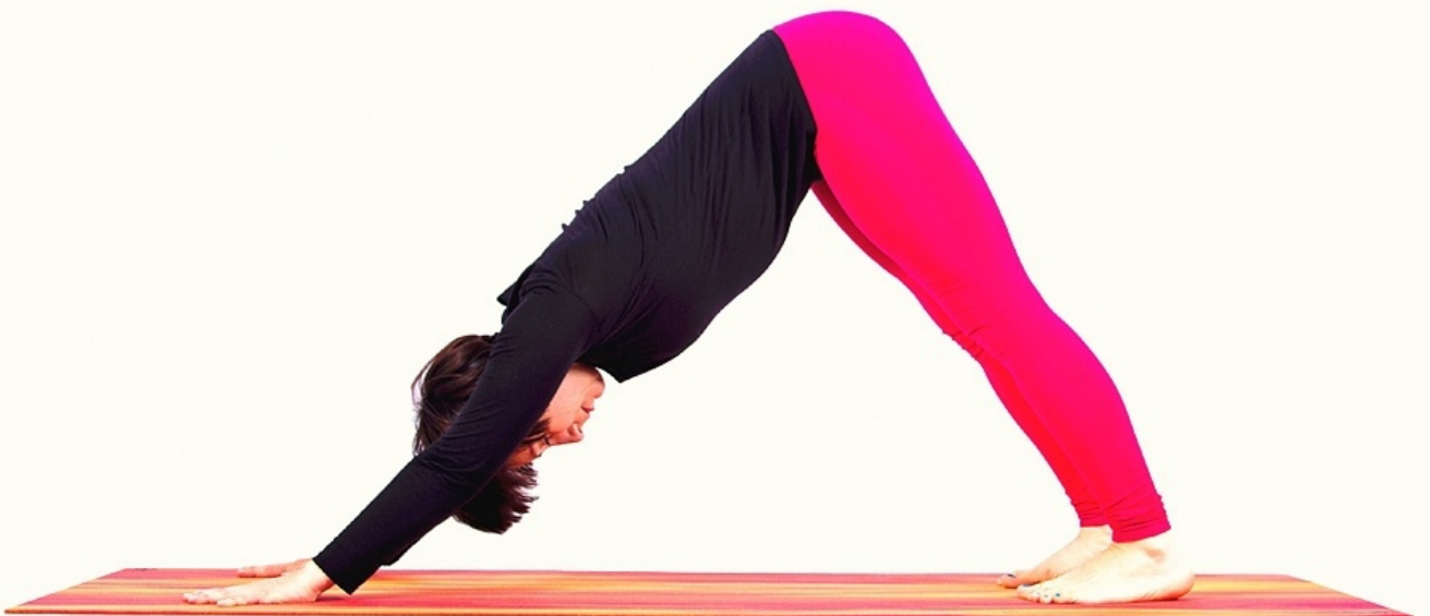
Pozycja psa z głową w dół ( Adho Mukha Svanasna )