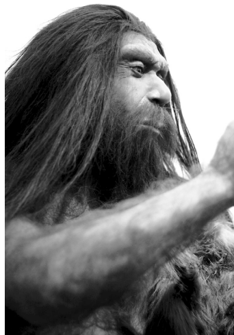
Długie włosy oznaczały dobre zdrowie teraz i w przeszłości

Należy jednak zachować ostrożność, porównując ewolucję włosów na głowie (związaną z eliminacją włosów, które szybko przestawały rosnąć albo rosły w nierównych kępkach lub też nie było ich wcale) do łysienia typu męskiego.