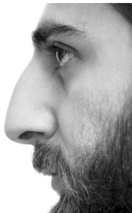
Wydutny nos tego mężczyzny jest dziedzictwem po przodkach, którym przydawał się on do nawilżenia suchego pustynnego powietrza, jakim oddychali

Mimo że ludzki nos jest większy niż u innych naczelnych, nasz zmysł węchu jest zdecydowanie słabszy. Może się to wydawać nielogiczne, warto jednak skupić się na innych istotnych funkcjach nosa: regulacji wilgotności i temperatury powietrza. Oczywiście nos służy do wąchania (choć ten zmysł stracił na znaczeniu, odkąd wzrok wyewoluował na najważniejszy z ludzkich zmysłów), ale oprócz tego pozwala oczyścić powietrze, które dociera do dróg oddechowych i zatok. Idealna temperatura wdychanego powietrza wynosi 35 stopni Celsjusza, a idealna wilgotność — 95%. Nos pozwala nam osiągnąć te warunki. Wyjaśnia to też, dlaczego ludzie żyjący w bardzo suchym klimacie (np. na Bliskim Wschodzie) często mają bardziej wydutne nosy. Po prostu większa powierzchnia błony śluzowej nosa pozwala na skuteczniejsze nawilżenie wdychanego powietrza.