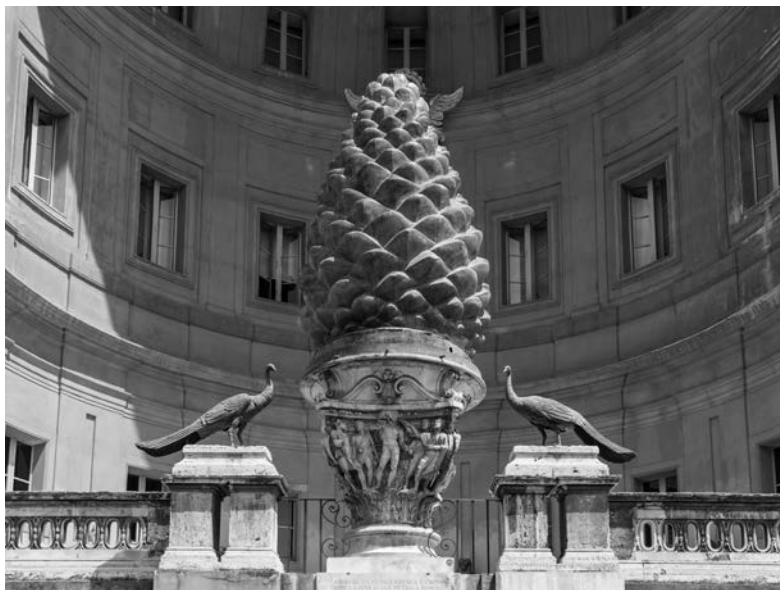
„Cortila della Pigna” w Watykanie

W hinduizmie spotykamy się z obrazami, w których symbolika szyszki łączy się z wężem. Wielu hinduskich bożków przedstawianych jest z szyszką w dłoni. W starych asyryjskich budowlach pałacowych, które powstały prawdopodobnie około 710 r. p.n.e., znaleźć można czteroskrzydłowe boskie figury trzymające w górze szyszki, co było interpretowane jako symbol wiecznego życia.