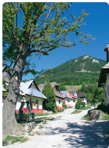
Vkolínec – chaty przy głównej ulicy

ski i zwoleński magister Donč w celu ochrony szlaku handlowego biegnącego do Polski. W latach 1431–34 zamek opanowali husyci, następnie znalazł się on w rękach rodu Hunyadych (Jana i króla węgierskiego Macieja Korwina) – którzy rozbudowali zamek górny i dodawszy poniżej nowe zabudowania, utworzyli obszerny zamek dolny. Po zburzeniu Starego Zamku Królewskiego w 1474 r. administrowano stąd liptowskimi majątkami królewskimi. W późniejszych latach zamek Likava był siedzibą rozległych majątków szlacheckich. W XVII w. częściowo przebudowano go w stylu renesansowym i rozbudowano jego fortyfikacje. Podczas powstań antyhabsburskich na przełomie XVII i XVIII w. został on znacznie zniszczony i od tego czasu pozostaje w ruinie. Obecnie zamkiem administruje Muzeum Liptowskie w Ružomberku (obiekt czynny 9.VI–15.IX codz. 9.00–17.00, poza sezonem na zwiedzanie zamku trzeba się umówić pod nr. tel.: +421 44 4322468).