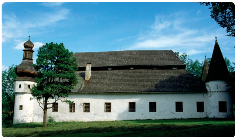
Liptovská Štiavnica – kasztel

Będąc w Ružomberku warto wspiąć się również na niewysokie, ale dość strome wzgórze Mnich (Mních, 695 m n.p.m.), na którym widoczne są ślady wałów kilku grodzisk kultur łużyckiej i puchowskiej. Trud wejścia wynagrodzą nam ponadto wspaniałe widoki na okoliczne pasma górskie, zaś schodząc do wsi MARTINČEK miniemy po drodze niewielki kościół św. Marcina , powstały ok. 1260 r., z cennym zespołem gotyckich malowideł z ok. 1300 r. – ich odsłonięcie spod XVII-wiecznych tynków w latach 1999–2001 było praw-