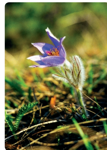
Sasanka na łące pod szczytem Wielkiego Chocza

Jadąc z Beszeniowej na północny wschód, w stronę Liptovskej Sielnicy warto po 5 km, w miejscowości Bobrovník, skrócić na północ, do wsi BUKOVINA . W tradycyjnym drewnianym gospodarstwie z poł. XIX w. urządzono ekspozycję etnograficzną ukazującą życie miejscowej ludności (stanowi ona oddział Muzeum Liptowskiego w Ružomberku). Natomiast skręcając w Bobrovníku na południe, dojrzymy do jednego z ciekawszych muzeów na wolnym powietrzu na Słowacji. Na wzgórzu Havránok (684 m n.p.m.), nad zalewem Liptovská Mara – na miejscu cennych znalezisk archeologicznych – zrekonstruowano wioskę celtycką z okresu ok. III–I w. p.n.e., tworząc skansen archeologiczny (Archeologické múzeum v prírode Liptovská Mara – Havránok – będące oddziałem Muzeum Liptowskiego w Ružomberku; tel.: +421 44 4322468, 4303533; otwarte w sezonie letnim codz. 9.00–18.00, a poza sezonem po wcześniejszym umówieniu; 40/20 Sk). Zobaczyć w nim można drewniany celtycki dom, fragmenty kamiennych obwałowań i druidzką świątynię . W niektóre niedziele organizowane są imprezy, mające przybliżyć sposób życia ludności celtyckiej i odbywające się tu pokazy walk rycerskich. W pobliżu skansenu, nad wodami zalewu, wznosi się wieża kościółta NMP , leżącego niegdyś na terenie miejscowości Liptovská Mara (pozostała część kościoła została przeniesiona do skansenu w Pribylinie, zob. s. 109). Urządzono w niej eks-