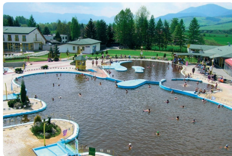
Kąpielisko w Beszeniowej

dziwą sensacją konserwatorską. U stóp wzgórza, nad Wagiem, znajduje się natomiast kilka ciekawych skałek, z których jedna, szczególnie efektowna, przypomina zaciśniętą pięść – i zwana jest Janosikową Pięścią .