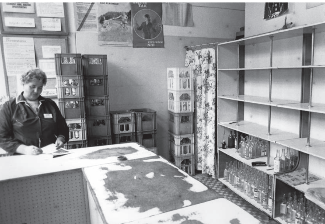
Sklep monopolowy otwarty jedynie po to, aby przyjmować zwroty. Warszawa, 3.10.1988 r.