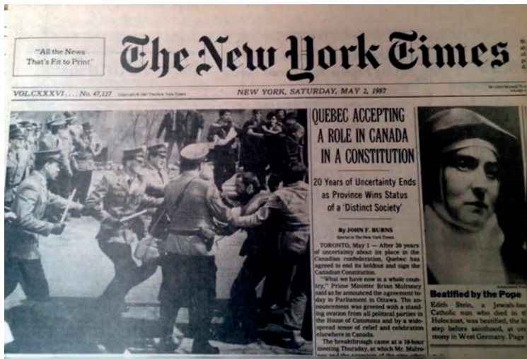
Zdjęcia Macieja Macierzyńskiego ilustrujące artykuły w „The Guardian” oraz „The New York Times”