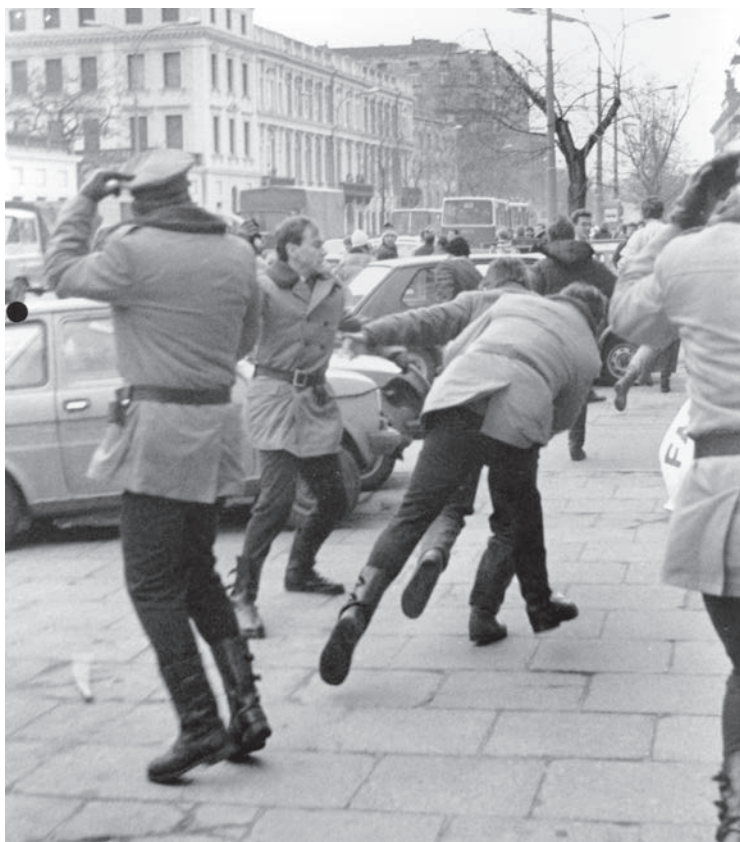
Milicja pacyfikuje demonstrantów w centrum Warszawy w siódmą rocznicę wprowadzenia stanu wojennego w Polsce. Warszawa, 13.12.1988 r.