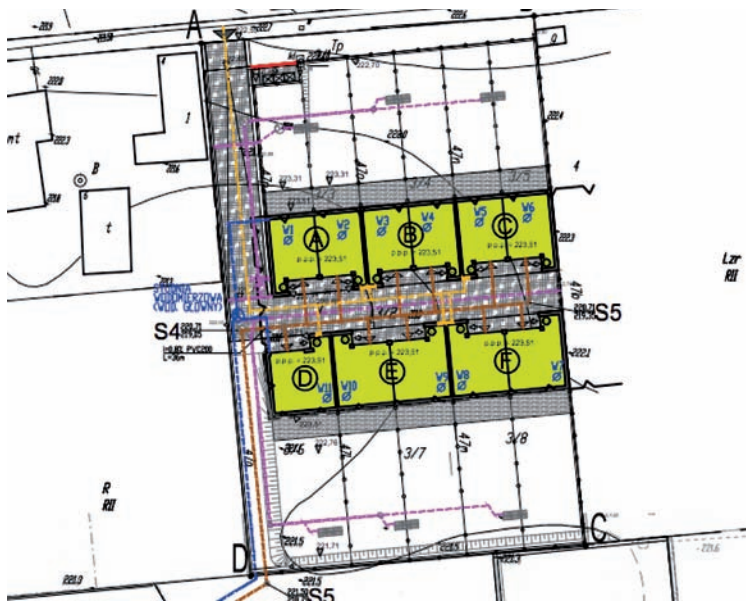
Konceptcja zagospodarowania działki