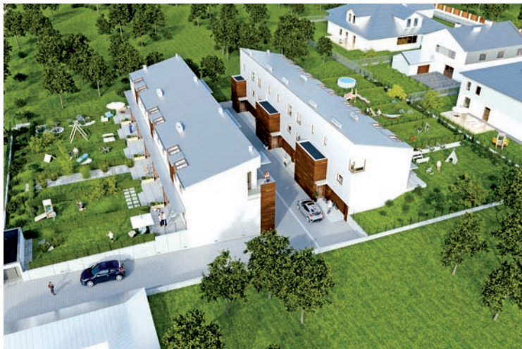
Wizualizacja zagospodarowania działki