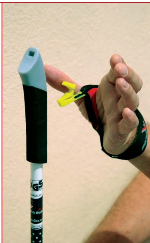
Łatwe spinanie rękawiczki i kija oraz łatwe wypinanie