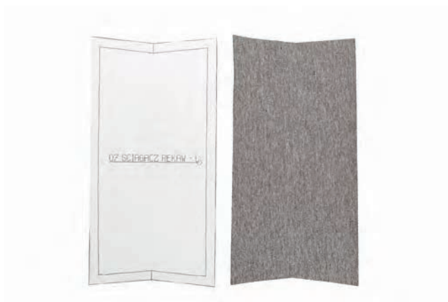
▲ ściągacze do rękawów