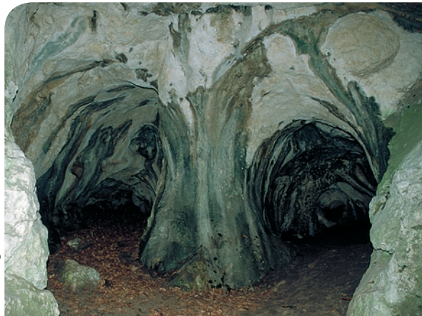
fol. Bogusław Czerwiński