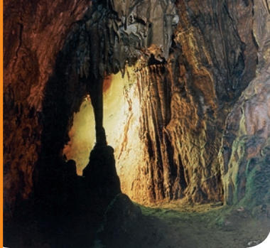
fol. Tomasz Gębuś