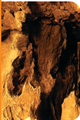
fol. Tomasz Gębuś