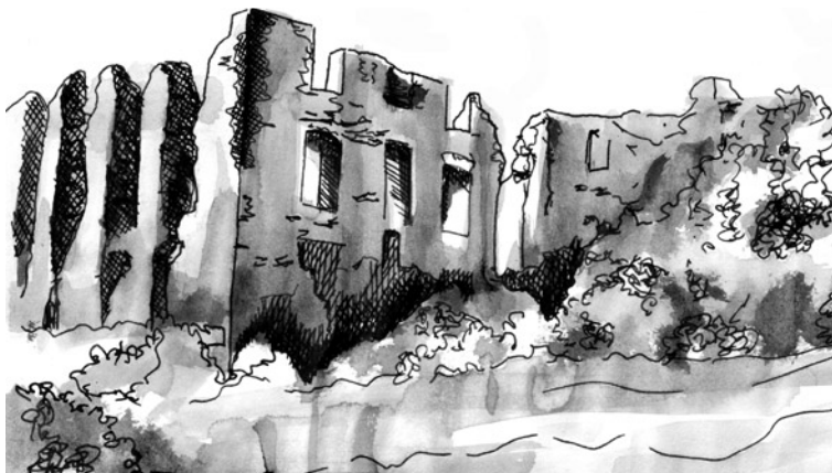
Ruiny zamku w Rabsztynie, rys. A. Fidzińska

czasów rezydencji. Kolejni właściciele wybudowali u stóp Kruczej Skały dwór starościński i folwark, w którym zamieszkali. Na początku XIX w. zamek został zupełnie opuszczony.