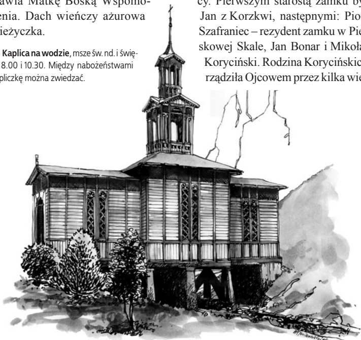
Kaplica na wodzie