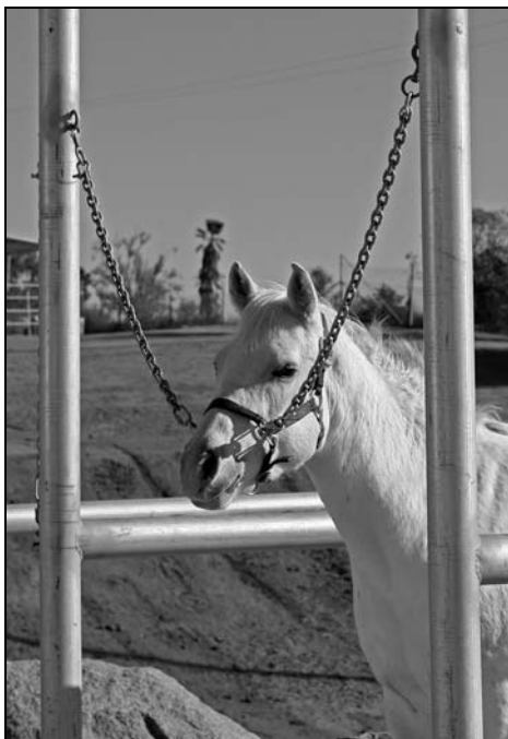
Rysunek 11.4. Koń uwiązany podwójnie za pomocą łańcuchów

Upewnij się, że koń, z którym pracujesz, został przyzwyczajony do takiego rodzaju wiązania. Jeżeli nie, może się przestraszyć, gdy go w ten sposób uwiążesz. Upewnij się też, że zapięcia mają możliwość łatwego zwolnienia, aby koń nie zawisnął na uwiązach, jeśli spanikuje. Chodzi o zabezpieczenie, które zwalnia się, jeżeli koń zaczyna oddziaływać na wiązania z ogromną siłą.