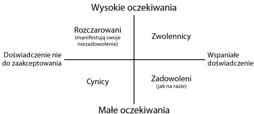
Rysunek 6.2. Spełnianie oczekiwań

Musisz spełniać oczekiwania ludzi. I aby to zrobić, musisz właściwie określić to, kim są. Następnie nie składaj nierealnych obietnic i pracuj nad przekraczaniem tych oczekiwań (patrz rysunek 6.2).