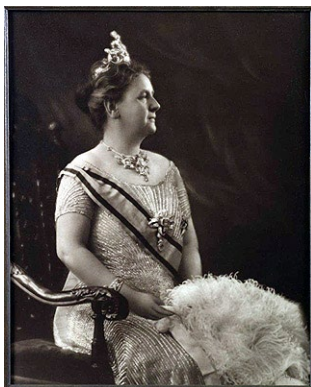
Zdjęcie: portret Królowej Wilhelminy z czasów II Olimpiady Szachowej

Wszelkie funkcje reprezentacyjne uświetniające i podnoszące rangę wydarzeń w Holandii były realizowane przez rodzinę królewską. Od 1898 r. tron należał do Królowej Wilhelminy i to ona czyniła odpowiednie honory w czasie IX Letnich Igrzysk Olimpijskich. W 1929 r., a więc rok po zakończeniu Olimpiady, Holandia popadła w kryzys – podobnie jak cała Europa. Państwo ogarnęła fala zamieszek, strajków i spadku dobrobytu.