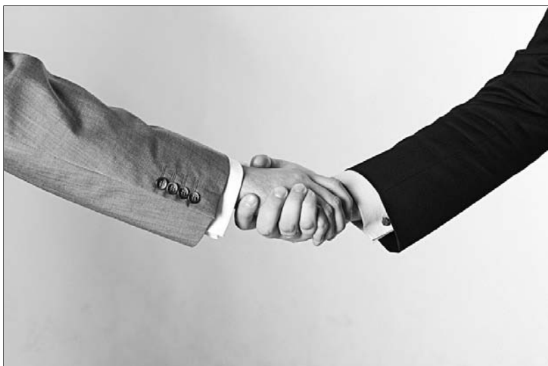
Zdjęcie 1.2. Dłoń niewłaściwie podana. Dłoń podana z góry sugeruje, iż chcemy górować, nie jest to zbyt eleganckie