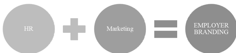
RYSUNEK 1.2. ZALEŻNOŚĆ POMIĘDZY OBSZAREM HR I MARKETINGU W EMPLOYER BRANDINGU. OPRACOWANIE WŁASNE

Employer branding czerpał, czerpie i będzie czerpał z zasobów marketingu. I bardzo dobrze! Uważam, że jako HR-owcy powinniśmy jak najwięcej korzystać z wiedzy marketingowej oraz praktyki osób zajmujących się marketingiem. Jeśli więc zajmujesz się obszarem HR-u, employer branding, czerp jak najwięcej od swoich koleżanek i kolegów z działu marketingu. Pytaj, proś o feedback, konsultuj swoje działania. Bo wiesz, employer branding jest tak naprawdę małżeństwem HR-u i marketingu właśnie (rysunek 1.2)!