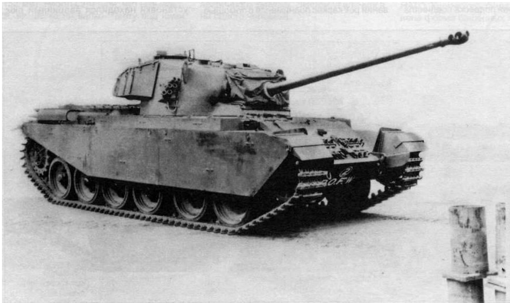
Rysunek 2: Wariant Mk-I

„Spitfire” i „Hurricane”. Zwrócono też baczną wagę na uzbrojenie, które zarówno pod względem kalibru jak i stosowanych pocisków miało być zdolne do nawiązania równorzędnego pojedynku z nowymi niemieckimi projektami. W odróżnieniu od poprzednich czołgów krążowniczych uznano że zdolność poruszania się w terenie jest ważniejsza od szybkości po drodze. Początkowo masę czołgu określono na maksymalnie 40 ton ale kiedy wystąpiły problemy bez oporów podniesiono limit masy do 60ton. Finalna specyfikacja powstała w 1944 roku w lutym i przewidywała uzbrojenie w działo 76,2mm 2 karabiny maszynowe BESA i polskie działko 20 mm Polsten. Przewidywano zawieszenie typu Horstmann i przekładnię Merrit Brown. Zasięg określono na 170 km co spowodowało potem wiele problemów. W maju 1944 roku zbudowano drewnianą makietę czołgu i złożono zamówienie na 20 przedseryjnych sztuk wykonanych ze zwykłej stali. Pierwszy wykonano we wrześniu 1944 roku a ostatni w styczniu 1945 roku. Waga prototypów wynosiła 45 ton. W 1945 roku do oddziałów w Europie wysłano 6 sztuk dla sprawdzenia przez załogi bojowe.