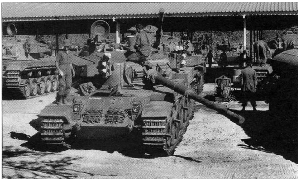
Rysunek 4: Olifanty 1A armii RPAi