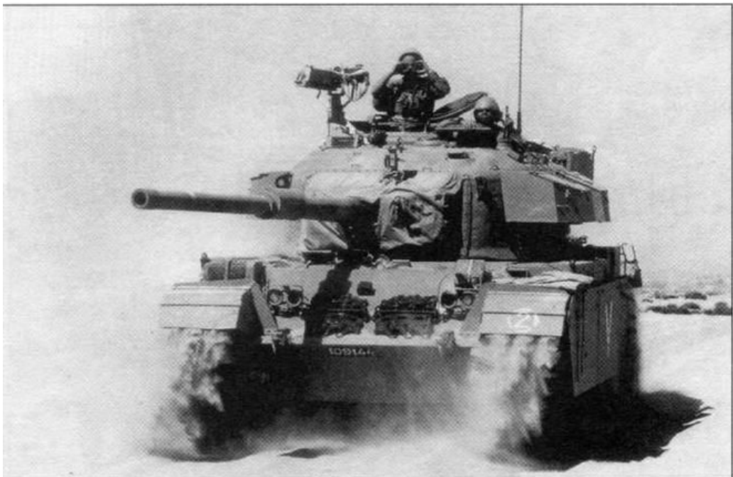
Rysunek 5: Izraelski Szot w akcji

Konieczność stałej modernizacji posiadanych czołgów była bardzo widoczna na czołgach posiadanych przez Izrael. Już w 1964 roku zastanawiano się nad przebrojeniem-ich w działa 120 mm z czołgu Chieftain