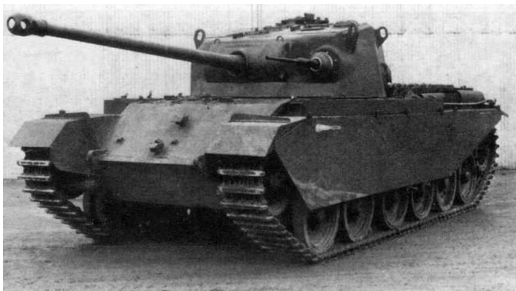
Rysunek 1: prototyp z działkiem Polsten

Pojawienie się nowych czołgów niemieckich jak T-V Panther i T-VI Tiger wyraźnie przewyższających stan posiadania armii brytyjskiej i liczne wady dotychczasowych konstrukcji skłoniły brytyjski Sztab Generalny do przygotowania nowych taktyczno technicznych wymagań na czołg z uwzględnieniem dotychczasowych doświadczeń. Pancierz czołowy wieży miał mieć grubość powyżej 125 mm a boczny powyżej 70 mm grubości, specjalnie uformowane dno zapewniało ochronę przed minami a boczne ekrany nad