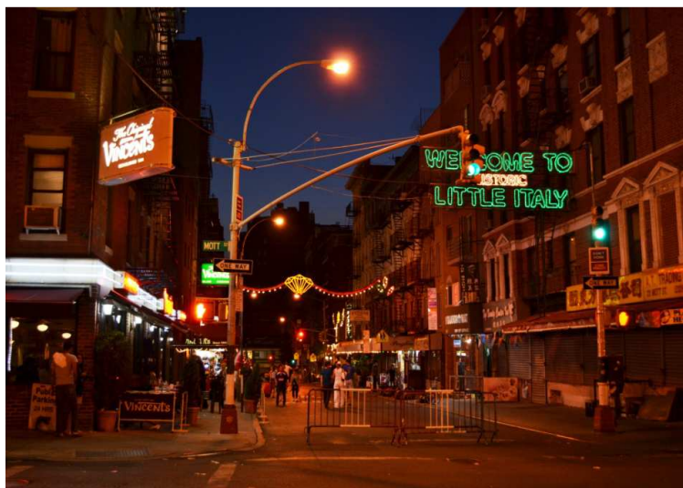
Fot. 1. 2012 r. – Little Italy w Nowym Jorku

W Stanach Zjednoczonych termin „enklawa” został zaadoptowany do określania zjawisk możliwych do wydzielenia w przestrzeni społecznej miasta i znalazł zastosowanie dla opisu takich „małych światów”, jak Little Italy , Little Havana czy Chinatown , które miały cechy etnicznie jednorodnych i ekonomicznie autonomicznych społeczności (Wilson, Martin, 1982). Później rozszerzono zakres znaczeniowy terminu także na mniejszości wyróżnione na podstawie stylu życia, statusu majątkowego lub kombinacji różnych cech, wskazując na istnienie w nich różnorodnych nieekonomicznych i nieetnicznych powiązań (Abrahamson, 1996: 1–2) oraz dobrowolność segregacji (Varady, 2005, vii).